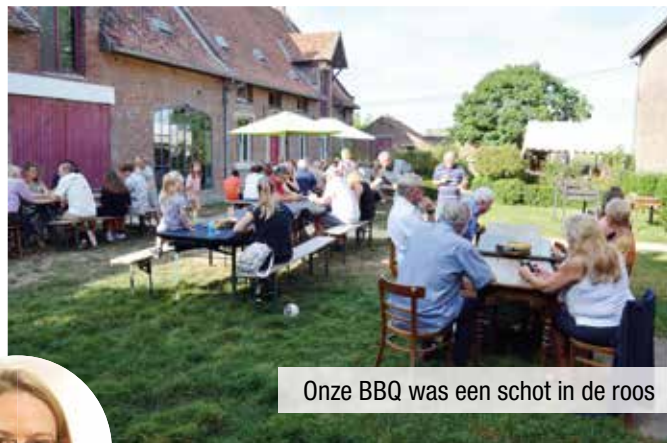
Onze BBQ was een schot in de roos

We kijken terug op een geslaagde editie en bedanken iedereen die aanwezig was. Wie niet kan wachten tot de BBQ van volgend jaar, kan ons komen vergezellen op de Sinterklaasbrunch op zondag 27 november 2022 in zaal Onder de Toren te Haacht . Tot dan!