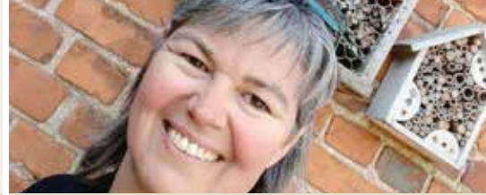
Geslaagde bijenactie (p. 3)